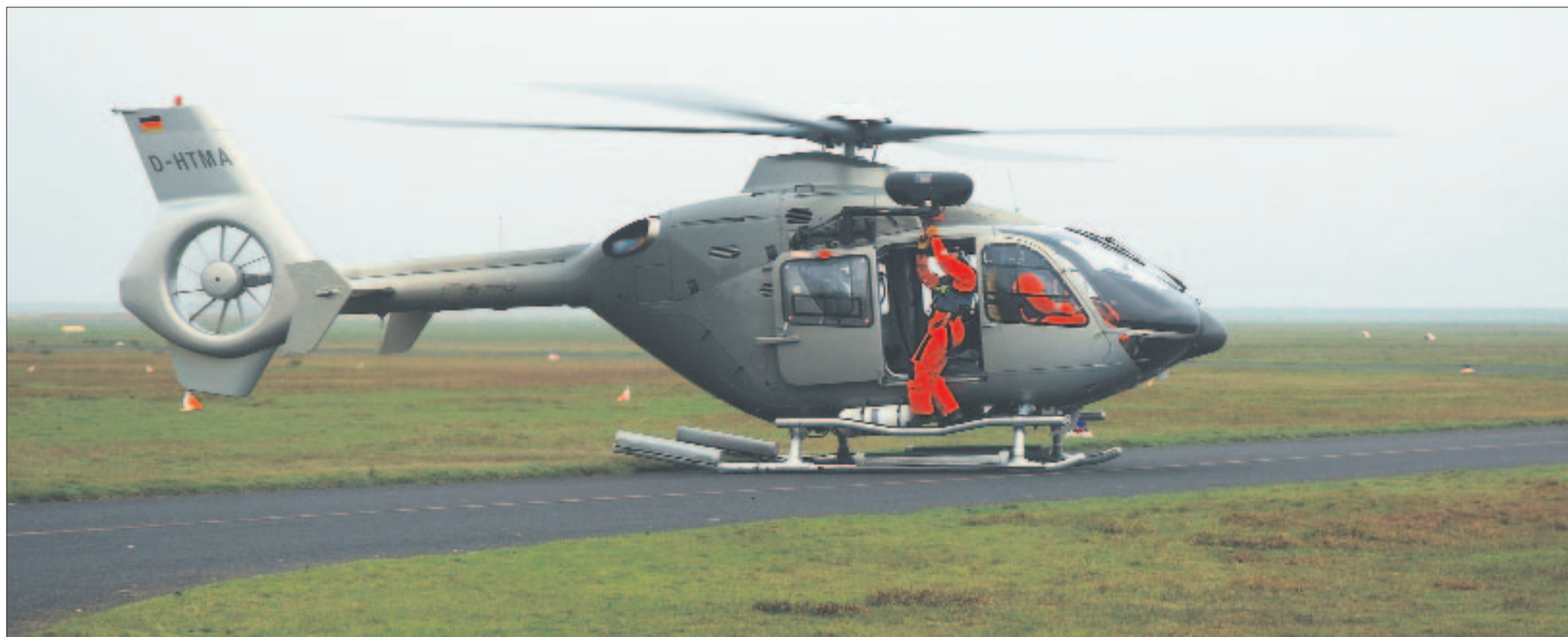
Sicher wieder gelandet: Der Eurocopter 135.